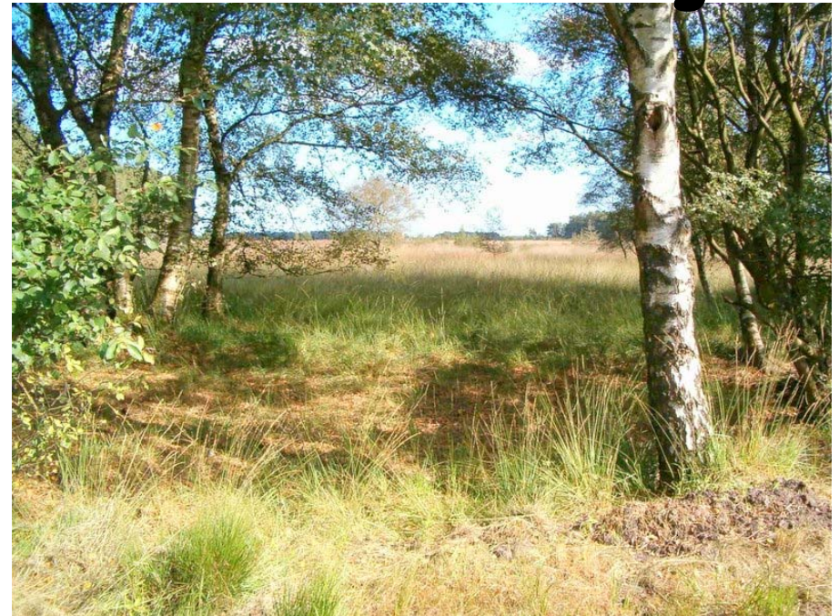
Een fietstocht van 34 km met prettige hindernissen